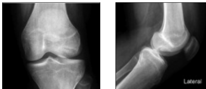
Figura 3. Radiografia em dois planos de um joelho, Osteocondrite dissecante

Neste contexto é preciso distinguir a luxação aguda da rótula por um traumatismo adequado, que é uma situação mais rara, da luxação rotuliana aguda por predisposição, sem traumatismo major ou mesmo sem traumatismo nenhum. Neste último caso, os jovens não conseguem, geralmente, explicar como aconteceu a luxação, referindo que o joelho simplesmente «falhou».