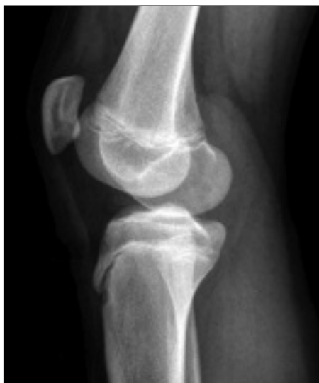
Figura 2. Radiografia em perfil de um joelho, alterações da tuberosidade anterior da tibia

tânea. Adolescentes com mais de 12 anos de idade e aqueles com lesões maiores de dois centímetros têm um potencial para fazer uma separação parcial ou até mesmo um descolamento do fragmento.