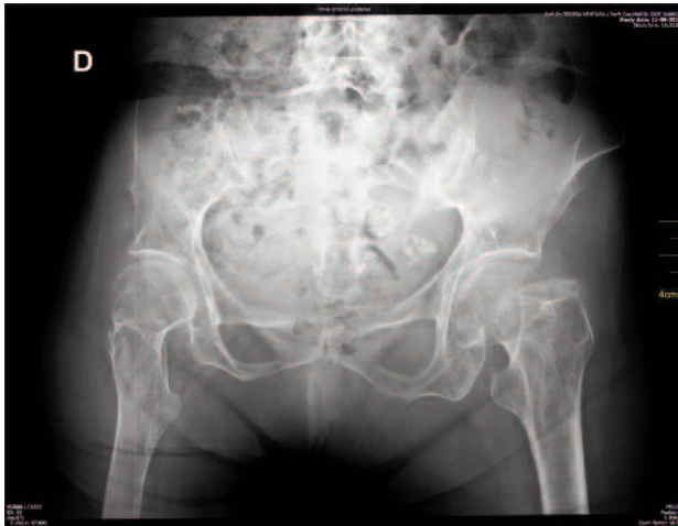
Figura 2. Radiograma da bacia.