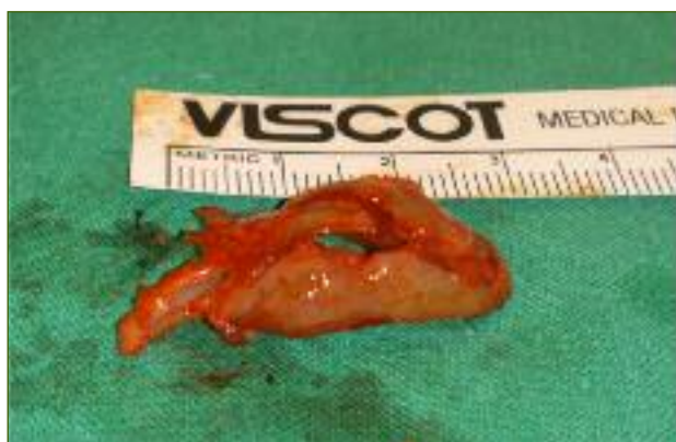
Figura 2. Concha média bolhosa excisada.

se é ou não unilateral. 2-4,14 Devem ser pesquisados sintomas acompanhantes, entre os quais rinorreia, alterações do olfato, dor facial, cefaleias, prurido nasal, esternutos, sintomas oculares e roncopia. 2-4,14 Também tem interesse o conhecimento sobre eventuais traumatismos nasais, tratamentos prévios e respetiva resposta. 2-4,14 O exame objetivo deve incluir a avaliação da existência de rinolália fechada e a pesquisa de sinais de atopia (como eczema atópico e dupla prega palpebral). 3 A pesquisa de sinais e sintomas de alarme é fundamental para exclusão