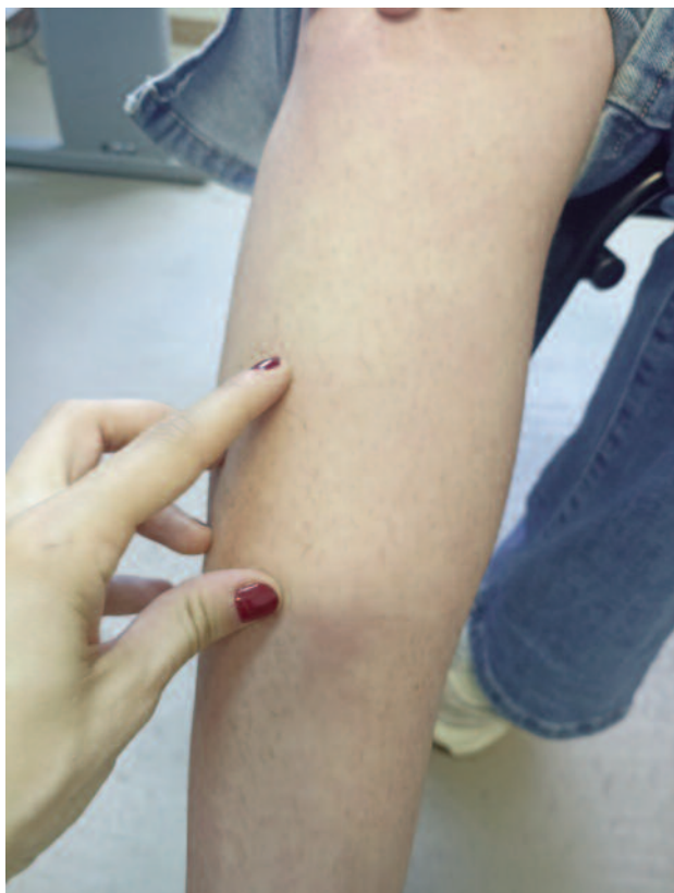
Figura 2. Região pré-tibial do membro inferior direito com a mão de profissional a apontar duas das lesões referidas (dedo indicador e polegar).