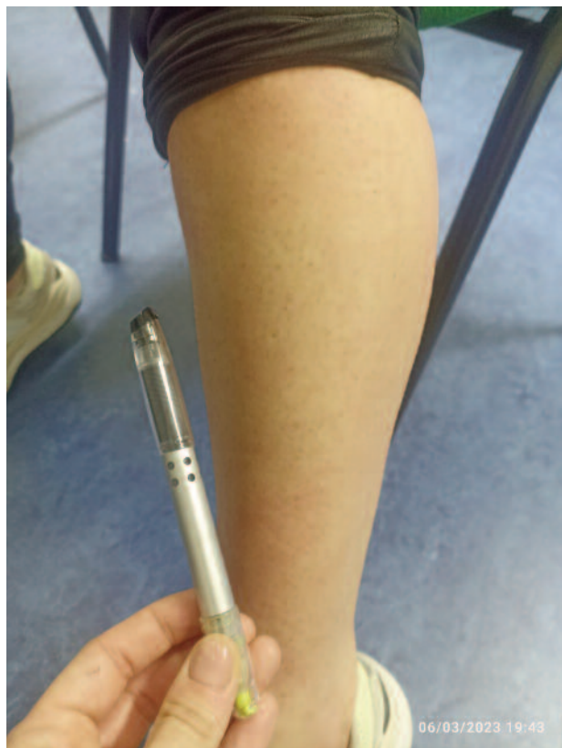
Figura 3. Região pré-tibial do membro inferior direito sem lesões visíveis.

total das mesmas. A utente nunca recorreu aos cuidados de saúde primários neste hiato temporal para esclarecimento destas lesões.